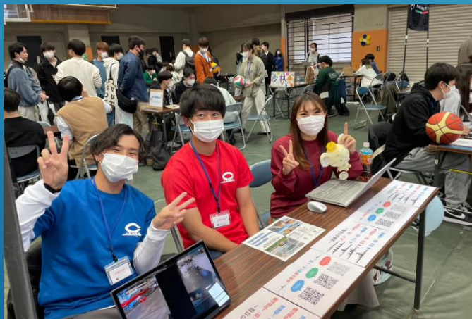
新歓活動 対面活動ができました！