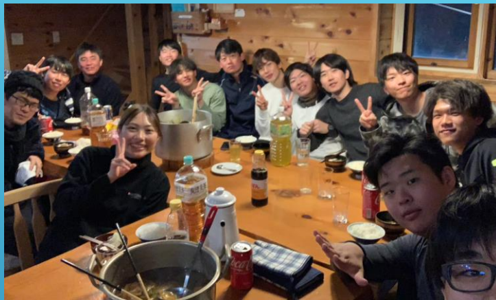
スキー旅行 冬の恒例行事も3年ぶり開催