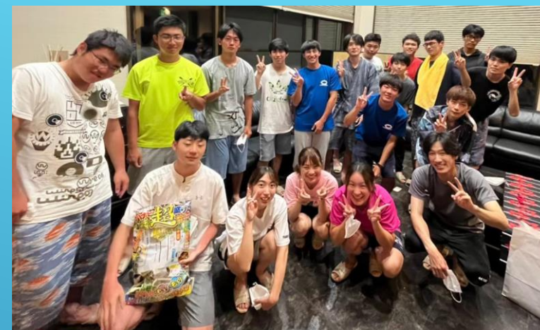
夏合宿@川辺 3年生にとっても初めての合宿でした