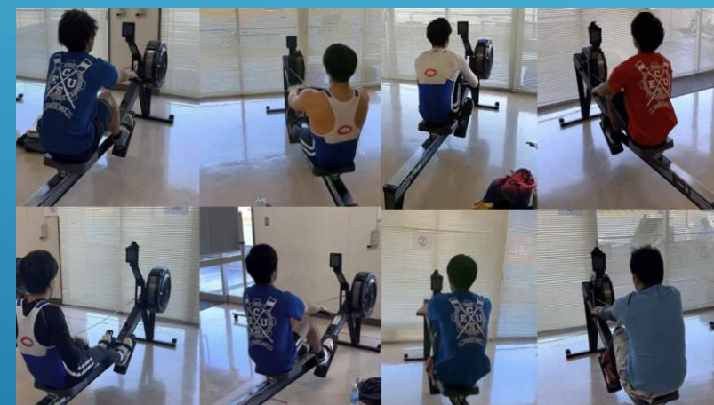
インドアローイング大会 8名が参戦！