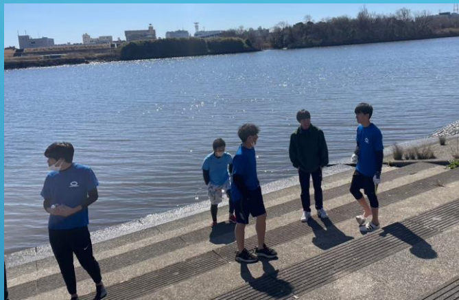
荒川遠漕 トラブルも収穫もあり...