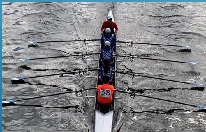
横浜ボートマラソン 4,200m 漕破！