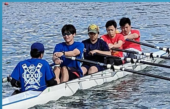
試乗会 相模湖ではモーター並漕