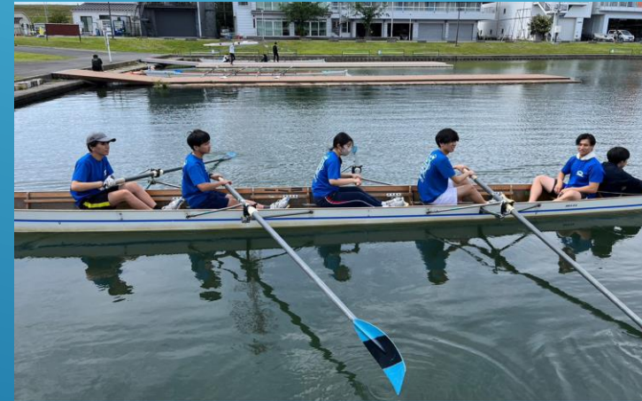
理工系レガッタ 62期のデビュー戦！