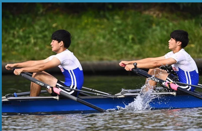
全日本新人 S栗生 B中島で年3レースに出漕！